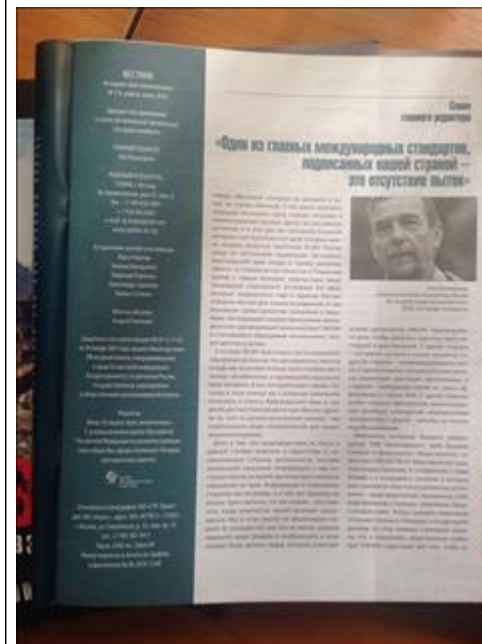
Вестник "В защиту прав заключенных" № 3-4, апрель-июнь за 2018 г. Фото разворота печатного экземпляра "Вестник в защиту прав заключенных" № 3-4, апрель-июнь за 2018 г.

Информация о собственном вкладе организации и использованном на реализацию проекта за отчетный период софинансировании.