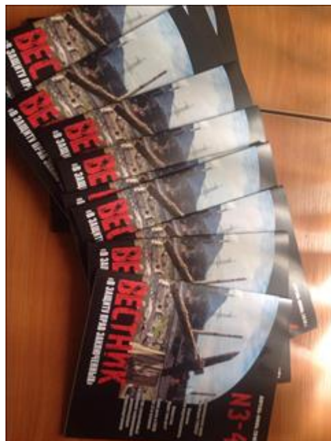
Вестник "В защиту прав заключенных" № 3-4, апрель-июнь за 2018 г. Фото печатных экземпляров "Вестника в защиту прав заключенных" № 3-4, апрель-июнь за 2018 г.

Информация, указанная Вами в данном поле отчета, будет доступна для посетителей сайта Фонда президентских грантов (в том числе представителей СМИ)